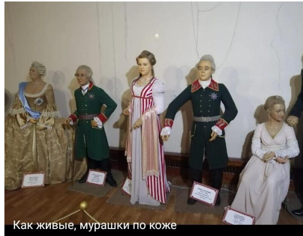
Как живые, мурашки по коже