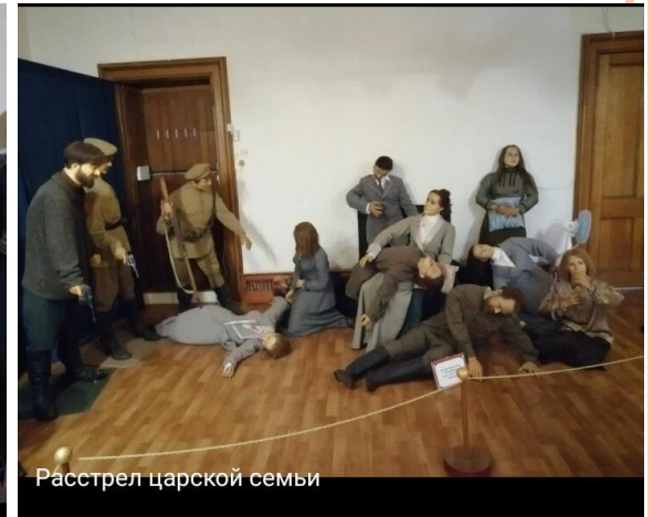
Расстрел царской семьи