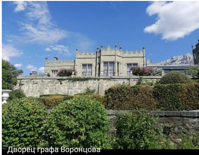
Дворец графа Воронцова